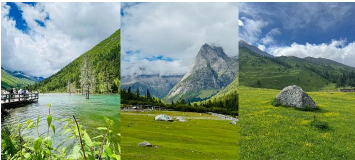
บ่าย นำท่านเที่ยวชม หุบเขาซวงเฉียวโกว เป็นจุดวิวทิวทัศน์ที่สวยงามที่สุด ชมความงามธรรมชาติของซวงเฉียวโกว(ลำน้ำสองสะพาน) ธารน้ำมีความยาว 35 กิโลเมตร มีทิวทัศน์ของภูเขาเป็นหลัก, ลำธารผ่านจุดต่างๆที่เป็นจุดทิวทัศน์ ไม่ว่าจะเป็น ซานกัวจวง, เขานิวซิน, เย่เหรินเฟิง ถือเป็นจุดท่องเที่ยวแห่ง