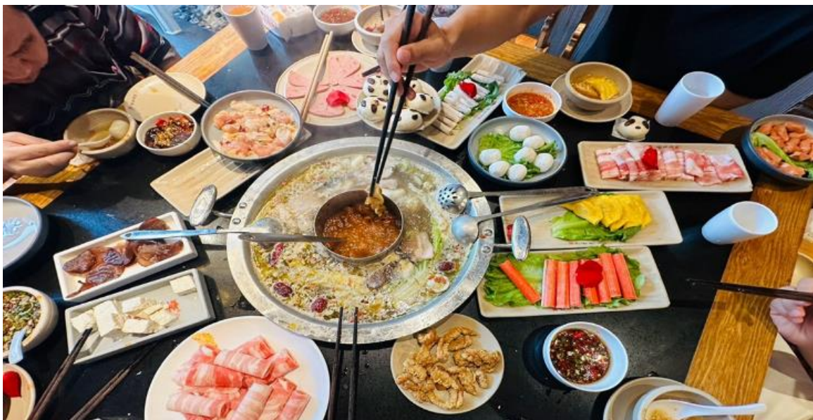
คำ รับประทานอาหารค่ำ ณ ภัตตาคาร (มื้อที่ 12) *เมนูพิเศษสุกี้หมอลำเสฉวน

อิสระช้อปปิ้ง ถนนไท่กุ่หลี่ หนึ่งในแหล่งช้อปปิ้งและไลฟ์สไตล์ระดับพรีเมียม ตั้งอยู่ใจกลางเมืองเฉิงตูโดดเด่นด้วยการออกแบบสถาปัตยกรรมที่ผสมผสานระหว่างความโมเดิร์นและวัฒนธรรมจีนดั้งเดิม มีทั้งแบรนด์แฟชั่นระดับโลกอย่าง Gucci, Chanel, Balenciaga รวมถึงร้านค้าไลฟ์สไตล์และแฟชั่นท้องถิ่น อาหารท้องถิ่นและคาเฟ่นานาชาติสวยๆ ที่เหมาะสำหรับการนั่งพักผ่อน